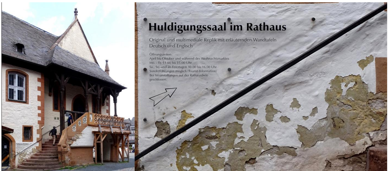
Man sieht dem ehrwürdigen Rathaus sein Alter an...

Unser besonderes Augenmerk richtet sich nun auf das Rathaus, einem Jahrhundertbauwerk, mit seinem Kleinod, dem "Huldigungssaal", entstanden zwischen 1505 und 1520 als Ratssitzungssaal.