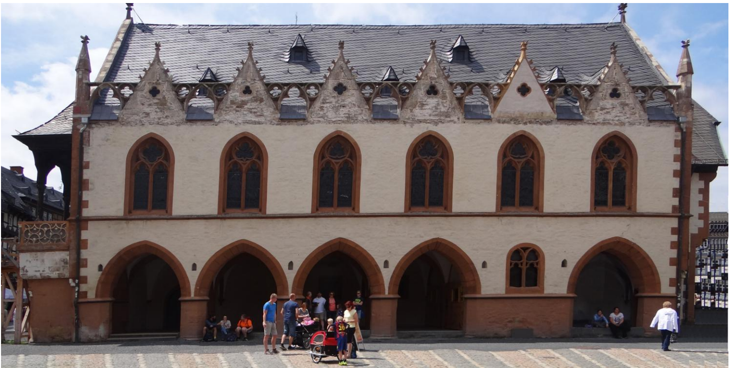
Das Goslarer Rathaus

Auf der Westseite des Marktes befindet sich das im 15.Jh. erbaute Rathaus mit seinen gotischen Arkaden und Fensterbögen sowie den verzierten Zwerchgiebeln (wegen Restauration nur als Attrappe zu sehen). Die bunten Fenster wurden erst Anfang des 20.Jh. eingesetzt. Die Freitreppe führt direkt in die Rathausdiele mit der blau gestrichenen Holzdecke mit den geschnitzten goldfarbenen Sternen, die 3 prunkvoll verzierte Messing-Kronleuchter aus dem 15. Jh. sowie 2 Geweihleuchter mit Kaiserfiguren trägt (aus dem Goslarer Dom stammend). Eine Besonderheit spätgotischer profaner Baukunst stellt das 4x4 m große ehemalige Sitzungszimmer mit Decken- und Wandgemälden auf Lindenholz dar. Dargestellt sind an den Wänden die Kaiser und Könige, die einst Goslar groß gemacht haben, sowie Sibyllen (weissagende Frauen). Die Deckengemälde zeigen die Menschwerdung Christi, die 4 Evangelisten und die 12 Propheten. Leider konnten wir aus konservatorischen Gründen den s.g. Huldigungssaal nur in einer multimedialen Darstellung erleben, allerdings durften wir einzeln einen kurzen Blick hineinwerfen.