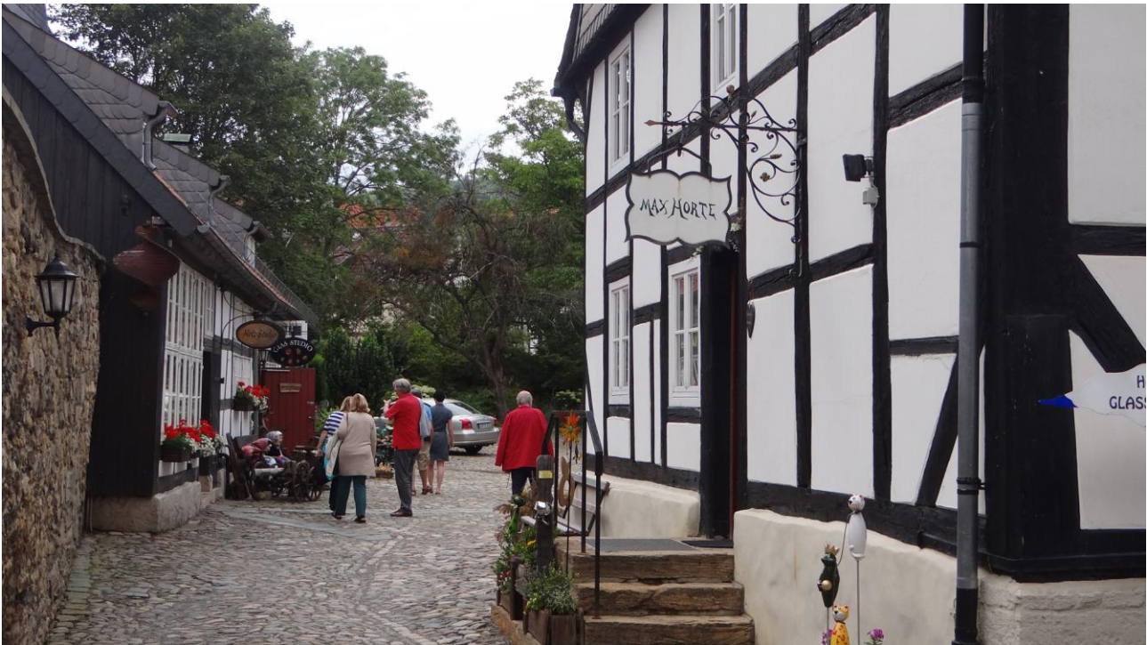
Blick in den heutigen Handwerkerhof vom Großen Hl. Kreuz

Während der Hallenbau heute den Rahmen für feierliche Anlässe bietet, kann man in den Pfründnerstuben Kunsthandwerkern über die Schulter schauen und deren Produkte käuflich erwerben.