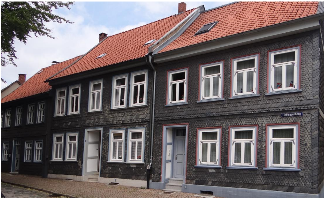
Die schiefer-behängten Häuser am Liebfrauenberg

Ausgangspunkt unserer Stadtführung ist der Parkplatz Kaiserpfalz, der ehemalige Standort der kaiserlichen Stiftskirche St. Simon und St. Judas aus dem 11. Jh., die im frühen 19. Jh. abgebrochen wurde. Erhalten sind die Domvorhalle mit dem Kaiserstuhl und im Pflaster nachgelegte Umrisse dieses bedeutenden 80m langen Gebäudes.