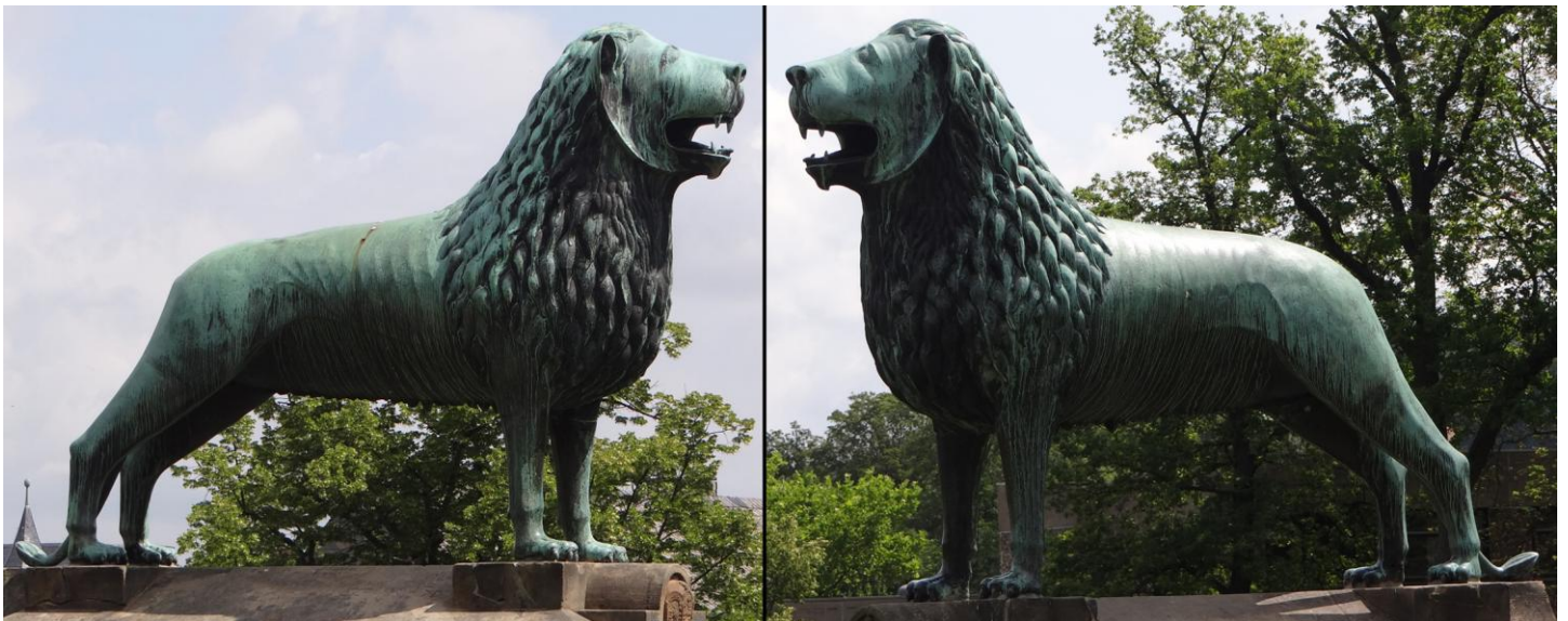
Nach dem Kauf der Kaiserpfalz durch das Königshaus Hannover zierten auch die Braunschweiger Löwen das Portal der Kaiserpfalz.

Erde sowie weltliche und geistliche Macht symbolisieren. Im Untergeschoß der Ulrichs-Kapelle soll sich in eine achteckigen Schatulle das Herz Heinrichs III. befinden. Die Grabplatte des Sarkophags aus dem 13.Jh. ist die zweitälteste Deutschlands und stellt Heinrich III. mit Zepter in der linken Hand und einer Kirche in der rechten Hand dar. 1219 fand der letzte Reichstag in Goslar statt, danach verlor Goslar seine politische Bedeutung als Zentrale des deutschen Reiches.