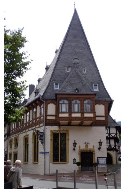
Das „Brusttuch“, Gildehaus der Filzhutmacher

Nicht weit davon befindet sich der Marktplatz - das Herzstück der Altstadt. Hier zieht zunächst die Kaiserwoth, ein früheres Gildehaus reicher Tuchhändler von 1494, und der Marktbrunnen unsere Aufmerksamkeit auf sich. Auf letzterem thront das Goslaer Wappentier, ein Adler.