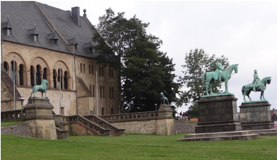
Die Vorreiter der heutigen Kaiserpfalz

Deshalb unternahmen am 15.7.2015 ca. 60 Teilnehmer des Seniorenstudiums der Universität Leipzig eine Exkursion in die über 1000-jähr. Kaiserpfalz und die Sozialeinrichtung zum Hl. Kreuz. In 3 Gruppen aufgeteilt begann die Besichtigung der Stadt an der nördlichen Eingangshalle – der Domvorhalle der ehemaligen Basilika im Pfalzbezirk. Auf dem heutigen Parkplatz unterhalb des Rammelsberges sind die Umrisse der 1050 geweihten 3-schiffigen romanischen Stiftskirche St. Simon und St. Lukas, gegenüber dem zeitgleich erbauten salischen Prachtbau – der Pfalz, noch zu sehen. Dieses Domstift wurde im 12.Jh. um 2 Seitenschiffe und die Domvorhalle erweitert, um 1820 wurde diese Basilika bis auf die Domvorhalle abgetragen.