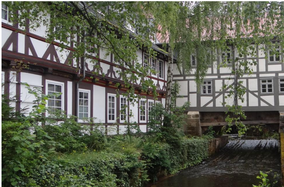
Das „Obere Wasserloch“, Eintritt der Gose in die Goslarer Altstadt

Weiter geht es durch enge, kopfsteingepflasterte Gassen und vorbei an Fachwerkhäusern mit Sonnenrosenornamenten und Spruchschwellen bis zum Hotel "Brusttuch", dem ehemaligen Gildehaus der Filzhutmacher aus dem frühen 16. Jh..