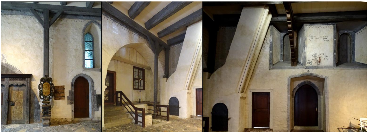
Ein Blick in das Innere des ehemaligen Hospitals „Großes Heiliges Kreuz“

Am Hohen Weg, der Verbindung zwischen Markt und Pfalzbezirk, betreten wir das "Große Heilige Kreuz", ein 1254 gegründetes Hospital als Einrichtung der städtischen Armenfürsorge für Bedürftige, Alte und Waisen. Auch Pilger und Durchreisende sollen hier Unterkunft und Verpflegung bekommen haben. Noch heute gibt es in einem Seitenflügel moderne Altenwohnungen. In den ehemaligen "Pfründerstübchen" entdecken wir hübsche Verkaufswerkstätten verschiedener Kunsthandwerker.