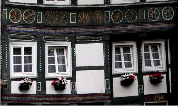
Viele alte Fachwerkhäuser Goslars tragen bunte Verzierungen

werden. Mit seinen Fachwerkhäusern (ca. 1000) bei 3-5000 Einwohnern zählte Goslar zu den mittelalterlichen Großstädten.