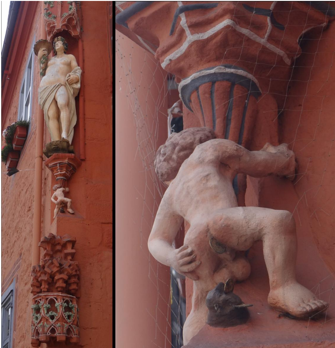
Das Strafgericht für Geldschuldner – deutlicher geht's nimmer!

Zwischen Rathaus und Kaiserringhaus präsentiert sich farbenprächtig das ehemalige Worthildehaus, das zusammen mit den Rathausarkaden – beide ehemals überdacht – auch als Handelsplätze diente, aber auch als Geldwechselstuben, zum Eichen von Maßen und Gewichten sowie als Gerichtsstätte Verwendung fand. Die Fassade des Worthildehauses schmücken zahlreiche Kaiser-Figuren aus Holz, angebracht im 19.Jh. Ein besonders spaßiges Rechtssymbol stellt das s.g. Dukatenmännchen dar als Mahnung und Abschreckung für die Geldschuldner.