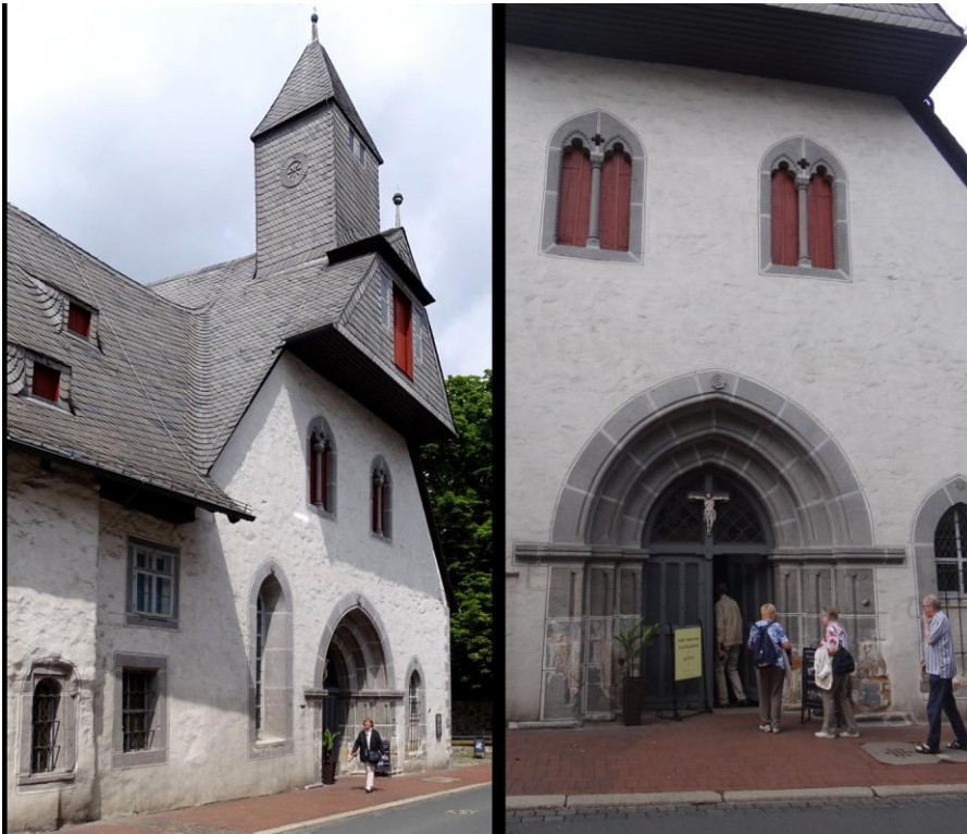
Das Große Hl. Kreuz

Seine prächtig gestalteten Decken und Wände mit Tafelgemälden vermitteln einen einzigartigen Eindruck in die spätgotische Raumkunst. Jedes einzelne Gemälde ist ein Kunststück von hoher Qualität, wie wir erfahren, und rechtfertigt die gegenwärtige Sicherheits-, Klima- und Lichttechnik zum Schutz der restaurierten Schnitzwerke.