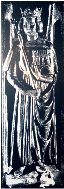
Heinrich III. auf der Deckplatte des Sarkophags, der das Herz Heinrichs III. birgt – beigesetzt wurde er im Petersdom in Rom.

Erde sowie weltliche und geistliche Macht symbolisieren. Im Untergeschoß der Ulrichs-Kapelle soll sich in eine achteckigen Schatulle das Herz Heinrichs III. befinden. Die Grabplatte des Sarkophags aus dem 13.Jh. ist die zweitälteste Deutschlands und stellt Heinrich III. mit Zepter in der linken Hand und einer Kirche in der rechten Hand dar. 1219 fand der letzte Reichstag in Goslar statt, danach verlor Goslar seine politische Bedeutung als Zentrale des deutschen Reiches.