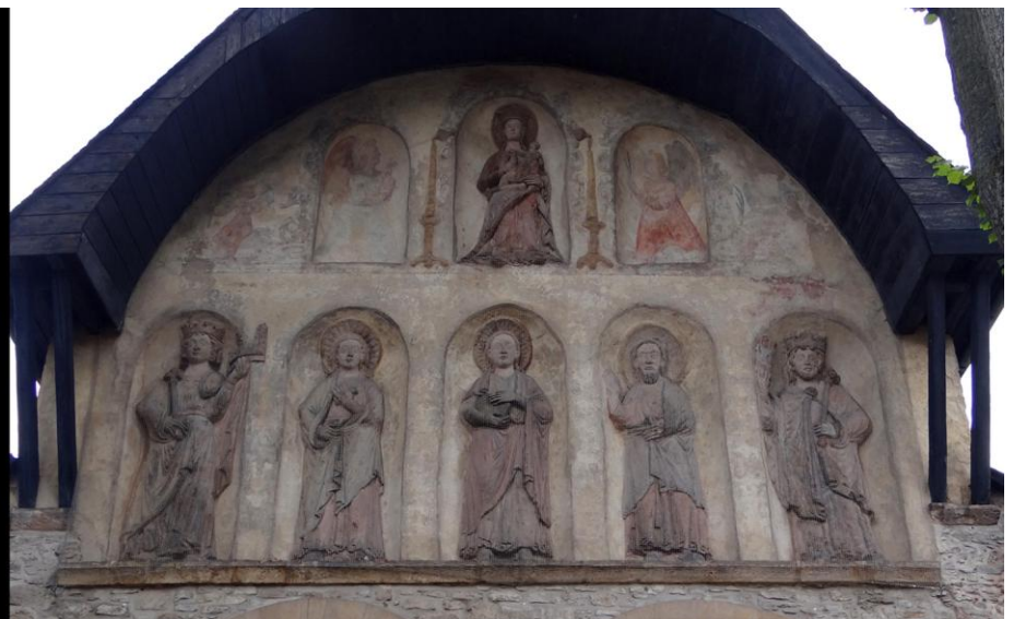
Links: Die Domvorhalle, die vom 1050 geweihten Dom St. Simon und St. Thomas übrig blieb.