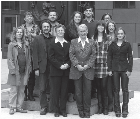
Mitarbeiter der Namenberatungsstelle im Mai 2011

sind wir der richtige Ansprechpartner für Sie!