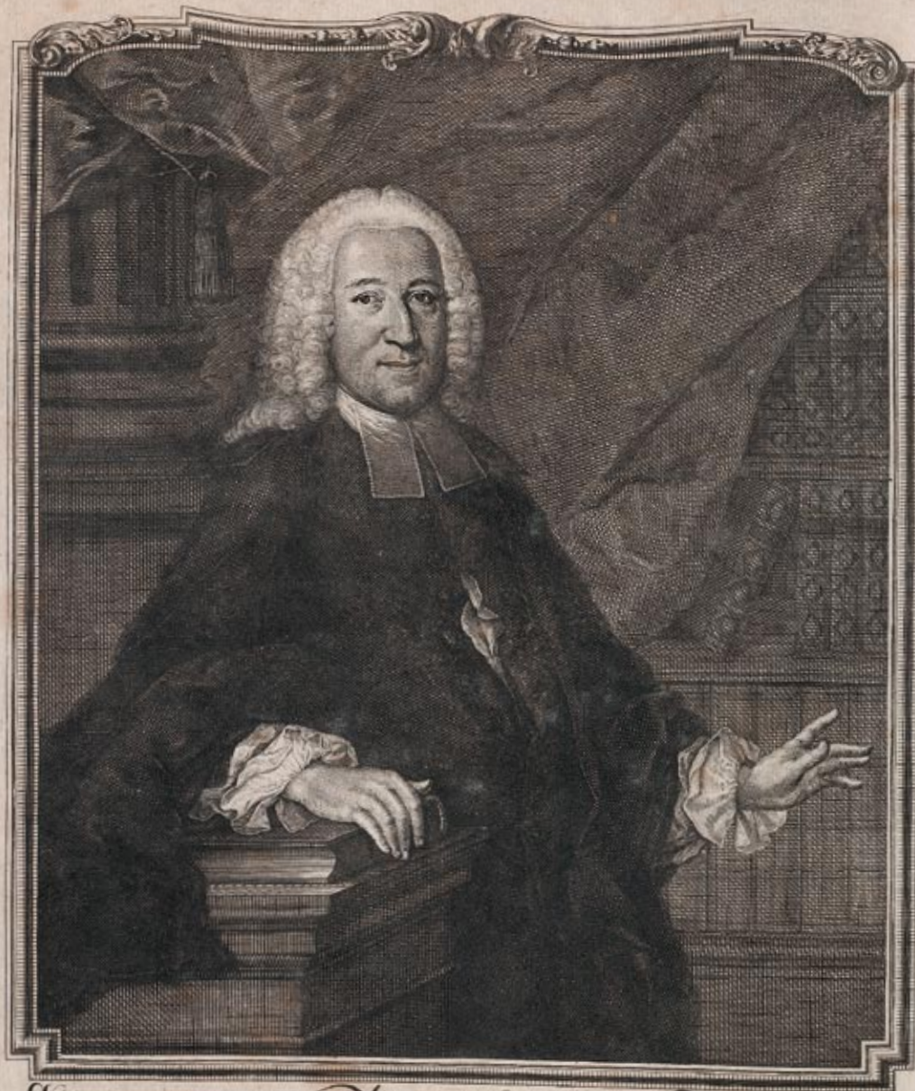
Christian Gottlieb Jöcher der Heil. Schrift Doctor und der Geschichte öffentlicher Lehrer auf der hohen Schule zu Leipzig.