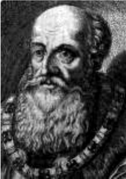
Georg der Bärtige

Herzog Georg der Bärtige regierte das albertinische Sachsen von 1500 bis 1539. Er erwies sich bereits während der Regentschaft seines Vaters Albrecht der Beherzte (1488-1500) als einer der fähigsten Herrscher seiner Zeit, vor allem durch seine umsichtig betriebene Wirtschafts- und Finanzpolitik, seine Sorge für das Rechts- und Verwaltungswesen und die Kreiseinteilung. Dazu kam eine rege Bautätigkeit.