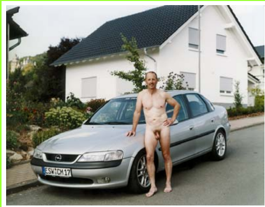
Abb. 5 und 6)

Rabea Eipperle, Unbekleidet mit Auto , 11teilig, je 40x50 cm, 2004.