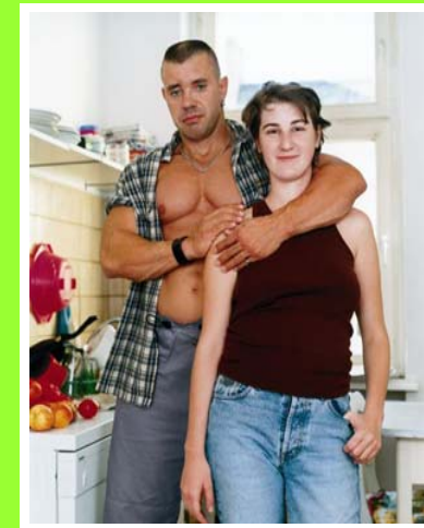
Abb. 4) Rabea Eipperle, Mit uns ein Gefühl , 11teilig, je 60x50 cm, 2003.