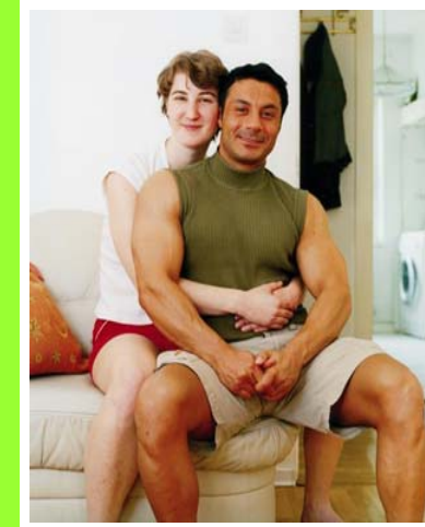
Abb. 3) Rabea Eipperle, Mit uns ein Gefühl , 11teilig, je 60x50 cm, 2003.