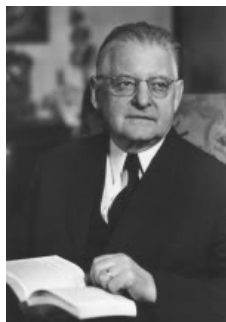
Friedrich Heiler (1892–1967)

„Die katholische Liturgie ist das objektivste religiöse Gebilde, das man sich denken kann. Alles ist bis ins Kleinste und Letzte festgelegt. Dem Liturgen wie der Gemeinde ist jede Freiheit in der Gestaltung des Gottesdienstes entzogen. Jede Körperbewegung, jede Geste, jedes Wort ist genau geregelt. Die peinlich sorgsame Ausführung des Rituals ist strengste Pflicht. [...] Eine kirchliche Behörde zu Rom [...] regelt alle liturgischen Fragen einheitlich für die ganze Welt [...].“ 7