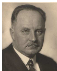
Wilhelm Stählin (1883–1975)