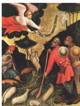
Meister der Lüneburger Goldenen Tafel, 15. Jh.

15 Und als die Engel von ihnen gen Himmel fuhren, sprachen die Hirten untereinander: Lasst uns nun gehen nach Bethlehem und die Geschichte sehen, die da geschehen ist, die uns der Herr kundgetan hat. 16 Und sie kamen eilend und fanden beide, Maria und Josef, dazu das Kind in der Krippe liegen. 17 Als sie es aber gesehen hatten, breiteten sie das Wort aus, das zu ihnen von diesem Kinde gesagt war. 18 Und alle, vor die es kam, wunderten sich über das, was ihnen die Hirten gesagt hatten. 19 Maria aber behielt alle diese Worte und bewegte sie in ihrem Herzen. 20 Und die Hirten kehrten wieder um, priesen und lobten Gott für alles, was sie gehört und gesehen hatten, wie denn zu ihnen gesagt war.