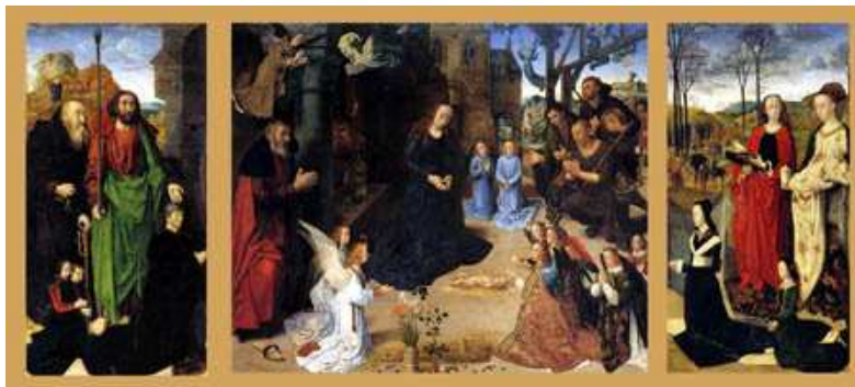
Hugo van der Goes, Portinari-Triptychon, 1482

„Ich steh an deiner Krippen hier, o Jesu, du mein Leben; ich komme, bring und schenke dir, was du mir hast gegeben ...“ (Paul Gerhardt, EG 37,1)