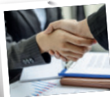
RECHTSBERATUNG – RECHTSGESTALTUNG – RECHTSDURCHSETZUNG