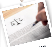
GRUNDLAGEN DES RECHTS