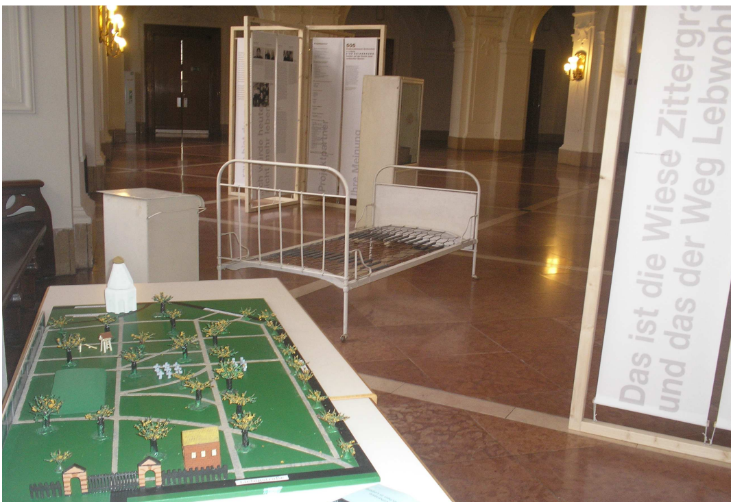
Foto 1: Ausstellung „505. Kindereuthanasieverbrechen in Leipzig.“ Links vorn im Bild ist das Modell des Friedenspark (ehemaliger Neuer Johannisfriedhof) zu sehen, auf dem die Mehrzahl der Kinderopfer beerdigt wurden